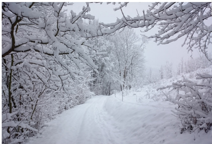
Na autobus jsou to 2 kilometry. K autu v zimě také (v létě jen půl). Meditace v pohybu – a hezky to drží kondici.

Je to tak. Já jsem teď zrovna pracovala s člověkem, který má psychózu, ale už ke mně bohužel přišel, když byl v aktivní fázi, už to bylo hodně rozjeté a potřeboval medikaci. A já jsem si uvědomila, že rozdíl mezi psychózou a psychospirituální